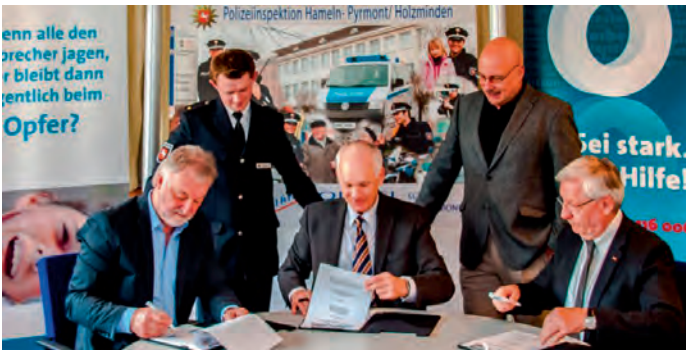
Unterschrift unter den Kooperationsvertrag mit der Polizei.