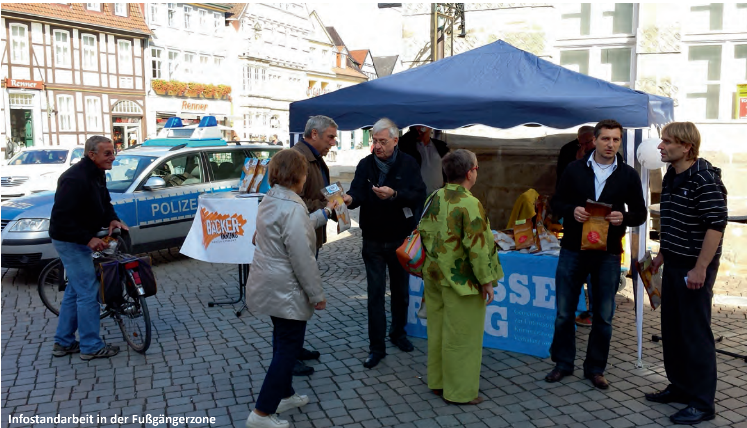
Infostandarbeit in der Fußgängerzone