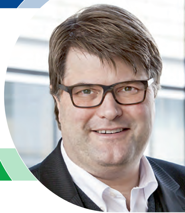
Tjark Bartels Landrat

Große Ereignisse werfen verheißungsvoll ihre Schatten voraus. Es sind nur noch wenige Wochen, bis wir in Hameln wieder einen glanzvollen und unterhaltsamen Polizeiball erleben werden. Am 21. Januar 2017 beschert uns die Gewerkschaft der Polizei Kreisgruppe Hameln-Pyrmont traditionell ein wahres Highlight des regionalen Veranstaltungskalenders. Bereits zum 46. Mal wird dieses glanzvolle gesellschaftliche Ereignis ausgerichtet.